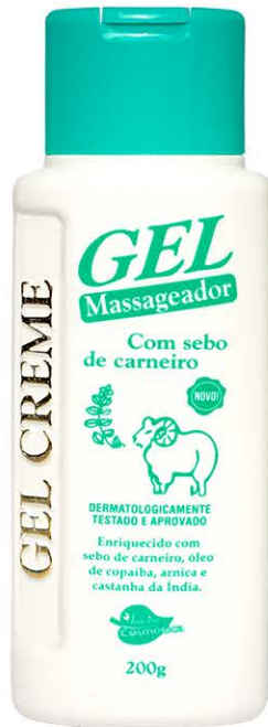
Gel Massageador Sebo de Carneiro 200g