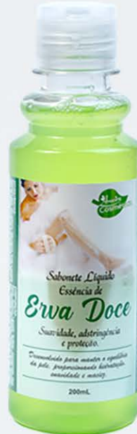
Sabonete Líquido Erva-Doce - 200ml