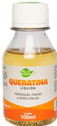
Óleos Queratina 100ml