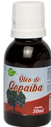
Óleos Copaíba 30ml