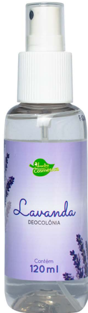
Deocolônias Lavanda 120ml