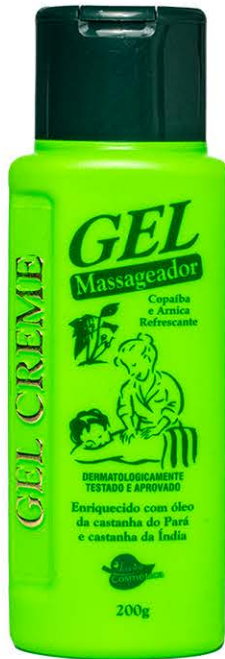
Gel Massageador Copaíba e Arnica Refrescante 200g