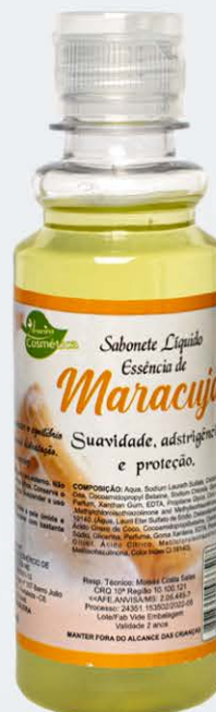
Sabonete Líquido Maracujá - 200ml