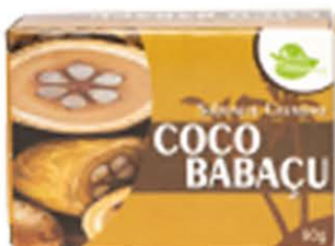
Sabonetes sólidos Coco Babaçu - 90g