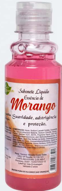
Sabonete Líquido Morango - 200ml