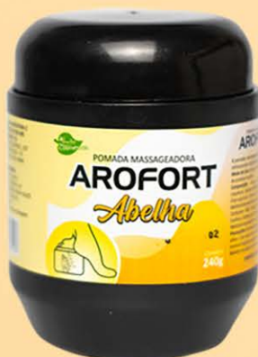
Pomada Massageadora Abelha - 240g