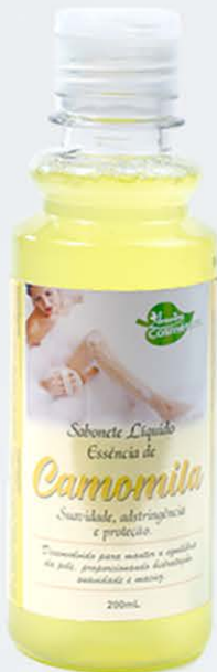
Sabonete Líquido Camomila - 200ml