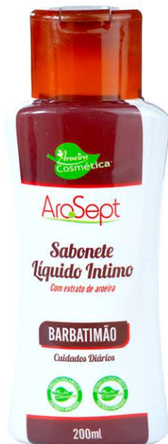
Sabonete Íntimo Barbatimão - 200ml