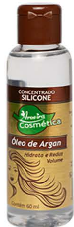
Óleos Argan 60ml