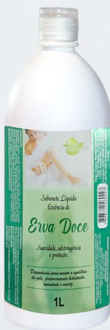
Sabonete Líquido Morango - 1L