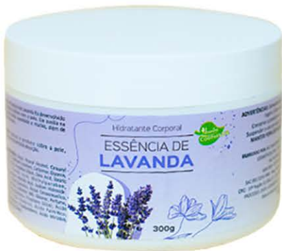
Hidratante Lavanda - 300g