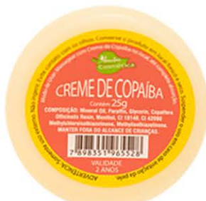
Creme Copaíba - 25g