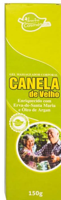
Gel Massageador Canela de velho - 150g