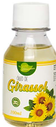
Óleos Girassol 100ml