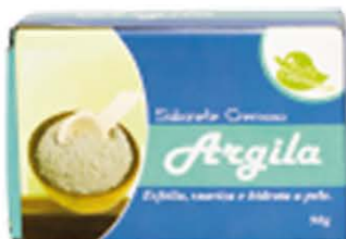
Sabonetes sólidos Argila - 90g