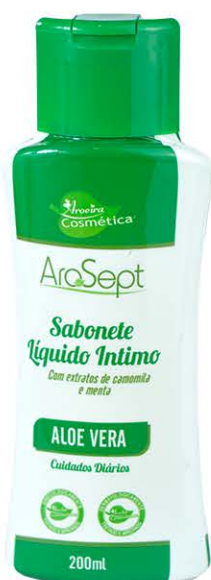
Sabonete Íntimo Aloe Vera - 200ml