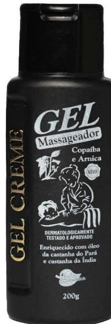
Gel Massageador Copaíba e Arnica 200g