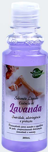
Sabonete Líquido Lavanda - 200ml