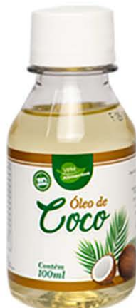
Óleos Coco 100ml