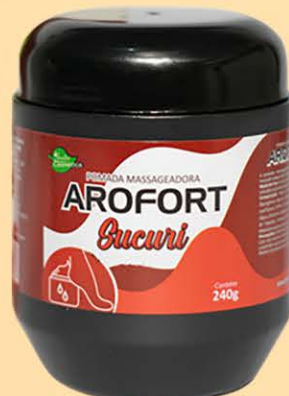
Pomada Massageadora Sucuri - 240g