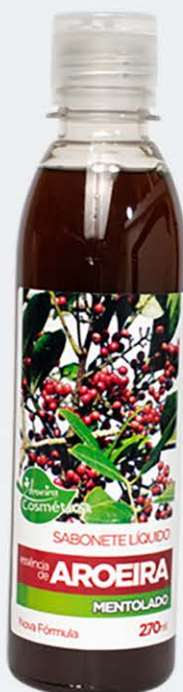
Sabonete Líquido Aroeira Mentolado - 270ml