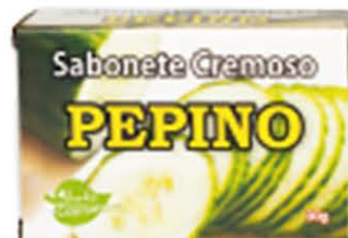
Sabonetes sólidos Pepino - 90g