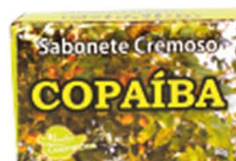
Sabonetes sólidos Copaiba - 90g