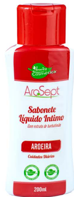
Sabonete Íntimo Aroeira - 200ml