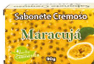
Sabonetes sólidos Maracujá - 90g