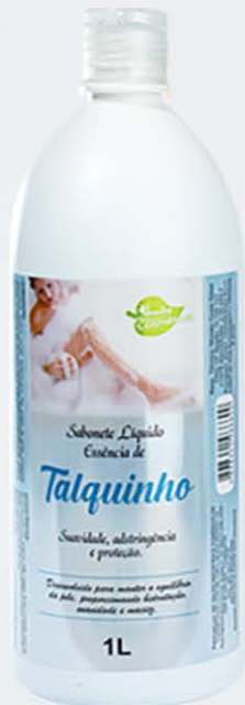
Sabonete Líquido Talquinho - 1L