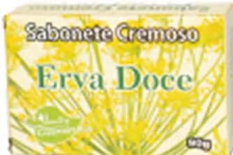
Sabonetes sólidos Erva-Doce - 90g