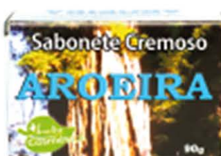
Sabonetes sólidos Aroeira - 90g