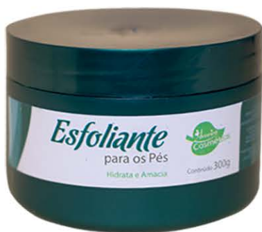
Esfoliante Para os pés - 300g