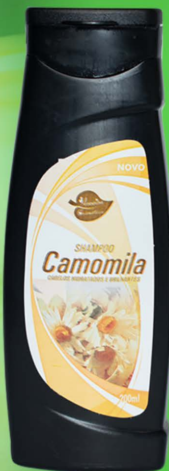
Shampoo Camomila - 200ml

Nossa formulação é a fusão entre o poder dos ingredientes naturais e o cuidado especializado para os seus cabelos. Descubra a leveza da camomila e a hidratação revitalizante da babosa em cada lavagem.