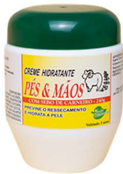
Creme Hidratante Sebo de carneiro - 200g