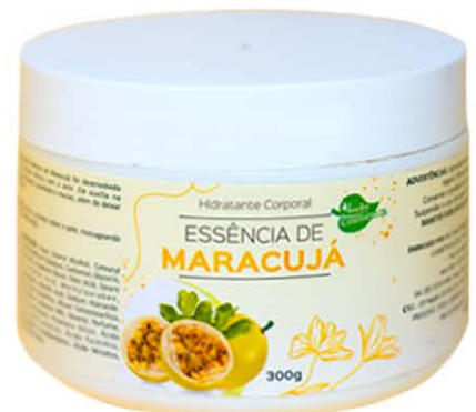
Hidratante Maracujá - 300g