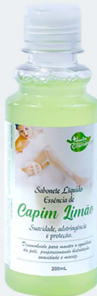
Sabonete Líquido Capim-Limão - 200ml