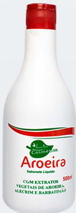
Sabonete Líquido Extratos vegetais de Aroeira, alecrim e barbatimão 200ml