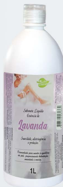
Sabonete Líquido Morango - 1L