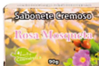
Sabonetes sólidos Rosa Mosqueta - 90g