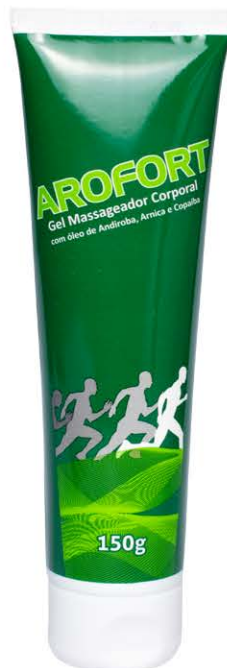
Gel Massageador AROFORT - 150g