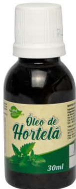
Óleos Hortelã 30ml