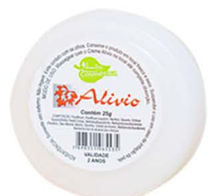
Creme Alívio - 25g