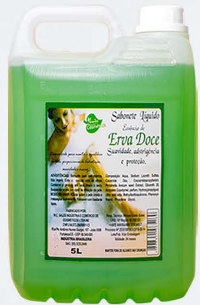
Sabonete Líquido Erva Doce - 5l