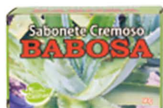
Sabonetes sólidos Babosa - 90g