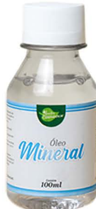
Óleos Mineral 100ml