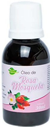
Óleos Rosa Mosqueta 30ml