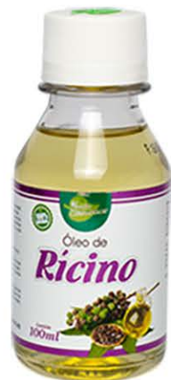
Óleos Ricino 100ml