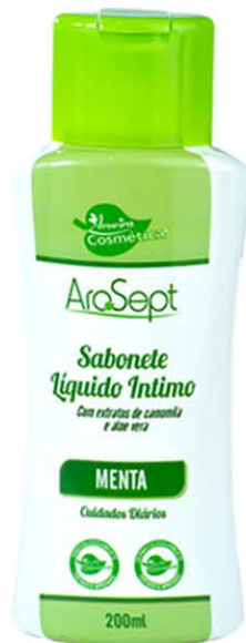
Sabonete Íntimo Menta - 200ml