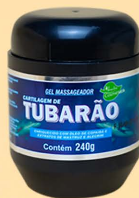
Gel Massageador Tubarão - 240g