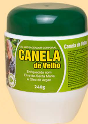
Gel Massageador Canela de Velho - 240g