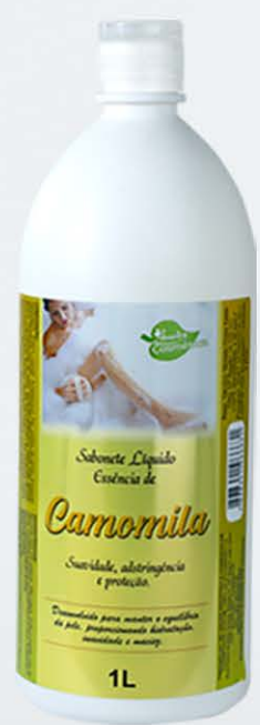
Sabonete Líquido Morango - 1L