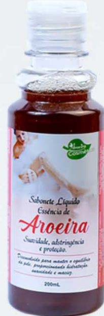
Sabonete Líquido Aroeira - 200ml