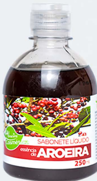
Sabonete Líquido Aroeira - 250ml