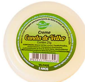
Creme Canela de velho - 25g