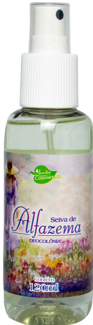
Deocolônias Alfazema 120ml