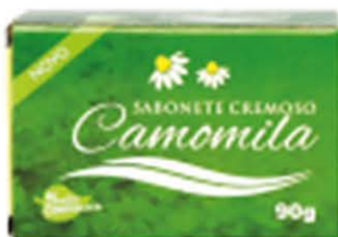
Sabonetes sólidos Camomila - 90g