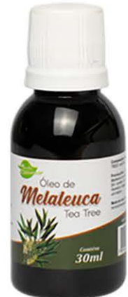
Óleos Melaleuca 30ml