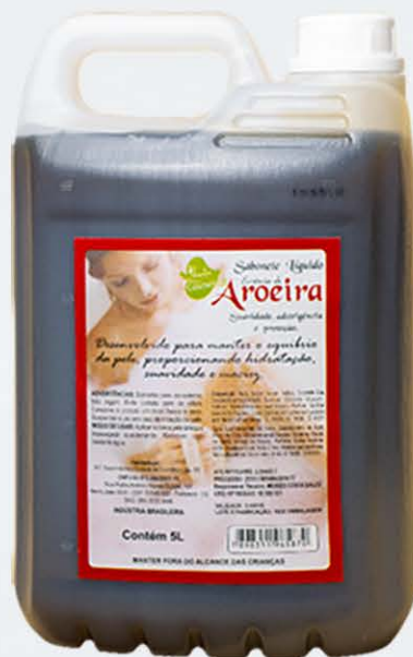
Sabonete Líquido Aroeira - 5l