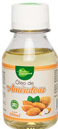
Óleos Amêndoas 100ml