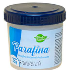
Parafina Tradicional - 50g