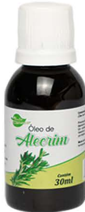
Óleos Alecrim 30ml