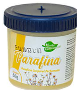
Parafina Camomila - 50g