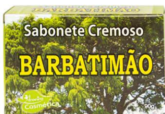
Sabonetes sólidos Barbatimão - 90g