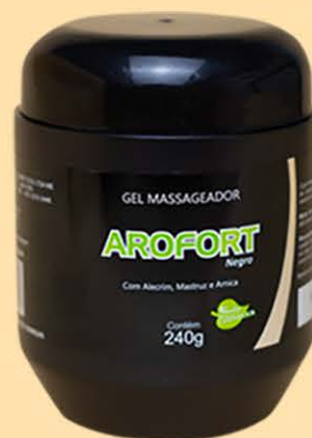
Gel Massageador Arofort Negro - 240g