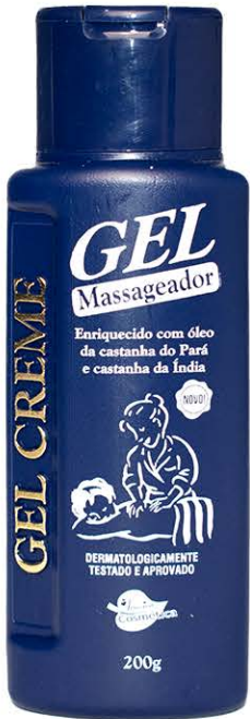
Gel Massageador Castanha da Índia e Castanha do Pará 200g