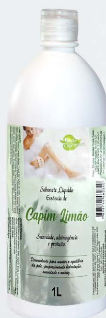
Sabonete Líquido Morango - 1L