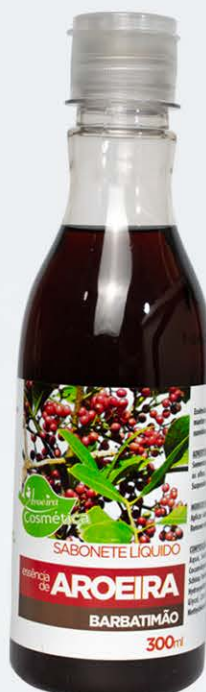
Sabonete Líquido Barbatimão - 300ml