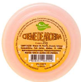
Creme Aroeira - 25g