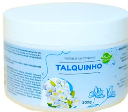
Hidratante Talquinho - 300g