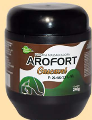
Pomada Massageadora Cascavel - 240g