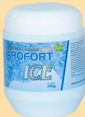
Gel Massageador Arofort ICE - 240g