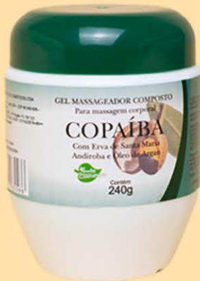
Gel Massageador Copaíba - 240g