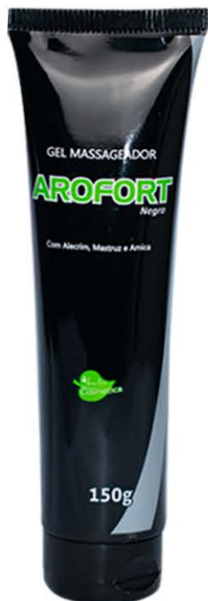
Gel Massageador AROFORT Negro 150g