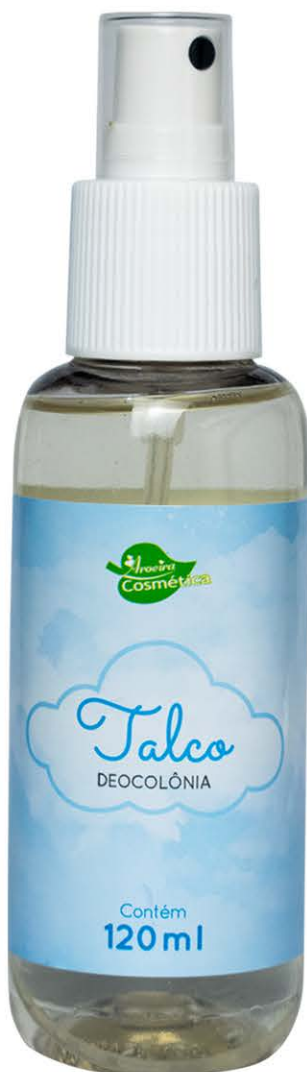
Deocolônias Talco 120ml