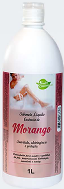
Sabonete Líquido Morango - 1L