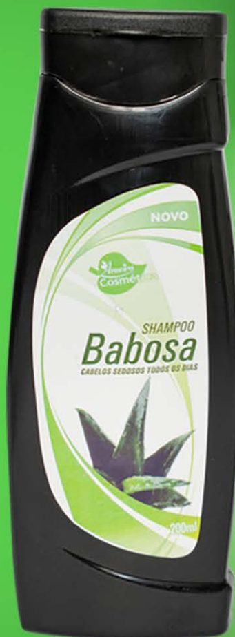
Shampoo Babosa - 200ml

Nossa formulação é a fusão entre o poder dos ingredientes naturais e o cuidado especializado para os seus cabelos. Descubra a leveza da camomila e a hidratação revitalizante da babosa em cada lavagem.