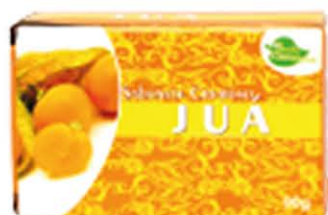
Sabonetes sólidos Juá - 90g