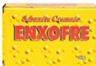
Sabonetes sólidos Enxofre - 90g