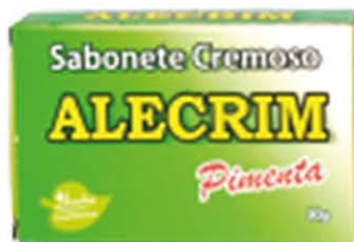
Sabonetes sólidos Alecrim - 90g