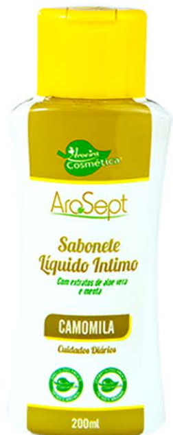
Sabonete Íntimo Camomila - 200ml