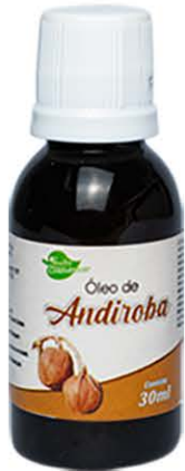
Óleos Andiroba 30ml