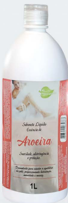
Sabonete Líquido Morango - 1L