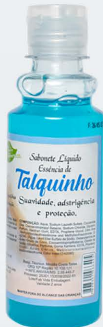
Sabonete Líquido Talquinho - 200ml