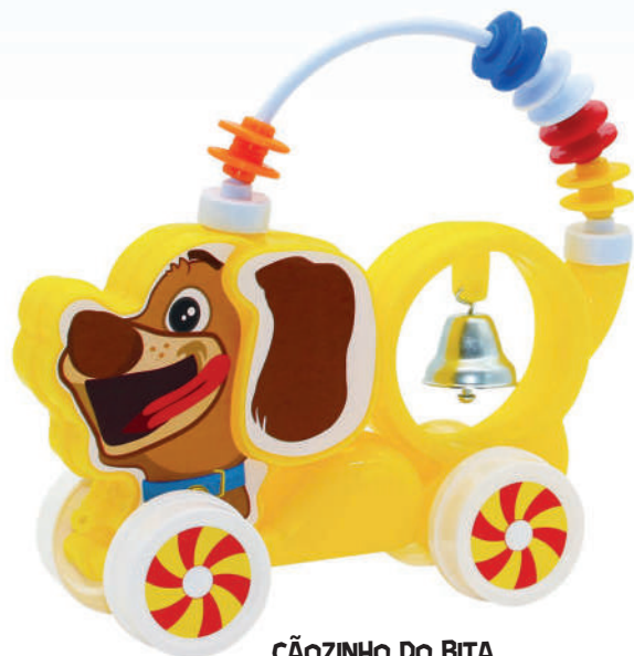
CÃOZINHO DO BITÁ REF: 0115

EAN13: 7896744801156 DUN14: 17896744801153 MEDIDAS: 23 X 08 X 19 CM CAIXA MASTER: 06 PEÇAS FAIXA ETÁRIA: 06 MESES PESO: 0,310 KG NCM: 95030080