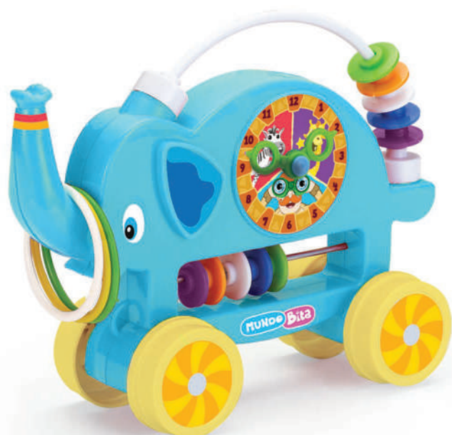
ELEFANTINHO DO BITÁ REF: 0120

EAN13: 7896744801200 DUN14: 17896744801207 MEDIDAS: 26 X 09 X 19,5 CM CAIXA MASTER: 06 PEÇAS FAIXA ETÁRIA: 06 MESES PESO: 0,310 KG NCM: 95030080