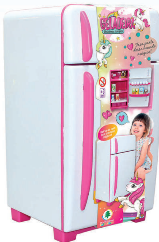
GELADEIRA UNICÓRNIO MÁGICO REF: 4595

EAN13: 7896744845952 DUN14: 17896744845959 MEDIDAS: 27 X 28 X 49 CM CAIXA MASTER: 2 PEÇAS FAIXA ETÁRIA: +3 ANOS PESO: 2,530 KG NCM: 95030099