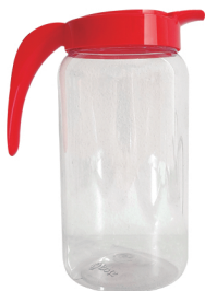
Jarra Lisa 1500ml - Caixa 12 unid. Ref.: 990