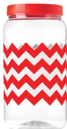
Pote Chevron Vermelho 1500ml Caixa 24 unid. Ref.: 390