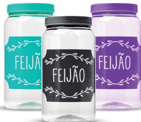
Pote Feijão 1500ml - Caixa 24 unid.