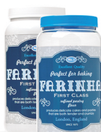
Pote Farinha 1500ml - Caixa 24 unid. Ref.: 375 (Branco) Ref.: 395 (Transp.)