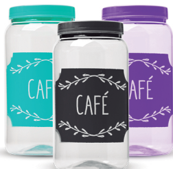
Pote Café 1500ml - Caixa 24 unid.