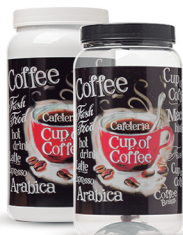
Pote Coffee Xicara 1500ml - Caixa 24 unid. Ref.: 355 (Branco) Ref.: 365 (Transp.)