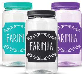
Pote Farinha 1500ml - Caixa 24 unid.