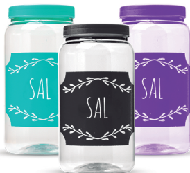
Pote Sal 1500ml - Caixa 24 unid.