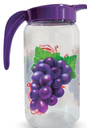
Jarra Uva 1500ml - Caixa 12 unid. Ref.: 995