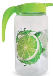
Jarra Limão 1500ml - Caixa 12 unid. Ref.: 993