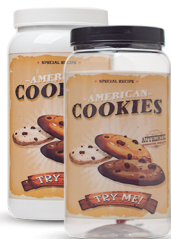
Pote Cookies 1500ml - Caixa 24 unid. Ref.: 356 (Branco) Ref.: 366 (Transp.)