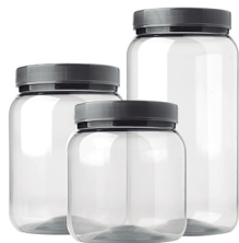
Pote Liso Transparente 700ml / 1000ml / 1500ml - Caixa 24 unid. Ref.: 181 / 281 / 381