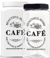
Pote Quadrado Café 1600ml - Caixa 24 unid. Ref.: 980 (Branco) Ref.: 971 (Transp.)