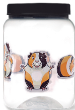
Pote Hamster 1000ml Caixa 24 unid. Ref.: 274