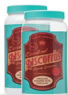
Pote Biscoito 1500ml - Caixa 24 unid. Ref.: 376 (Branco) Ref.: 396 (Transp.)