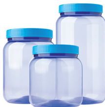
Pote Liso Azul Transparente 700ml / 1000ml / 1500ml - Caixa 24 unid. Ref.: 184 / 284 / 384