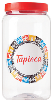
Pote Tapioca 1500ml - Caixa 24 unid. Ref.: 894