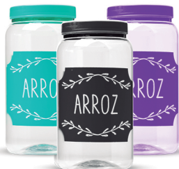
Pote Arroz 1500ml - Caixa 24 unid.