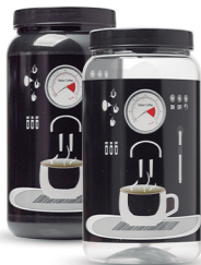
Pote Maq. de Café 1500ml - Caixa 24 unid. Ref.: 353 (Branco/Preto) Ref.: 363 (Transp.)