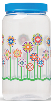
Pote Flor 1500ml - Caixa 24 unid. Ref.: 351