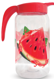
Jarra Melancia 1500ml - Caixa 12 unid. Ref.: 994