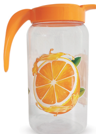
Jarra Laranja 1500ml - Caixa 12 unid. Ref.: 992