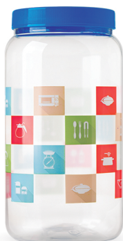
Pote Cozinha 1500ml - Caixa 24 unid. Ref.: 352