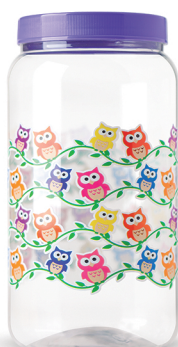
Pote Coruja 1500ml - Caixa 24 unid. Ref.: 361