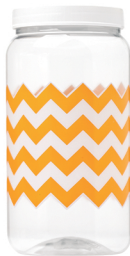
Pote Chevron Laran. 1500ml Caixa 24 unid. Ref.: 394