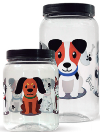
Pote Dog 1000ml / 1500ml - Caixa 24 unid. Ref.: 271 / 371