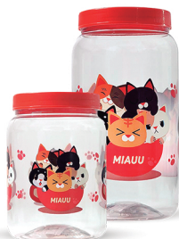
Pote Cat 1000ml / 1500ml - Caixa 24 unid. Ref.: 272 / 372