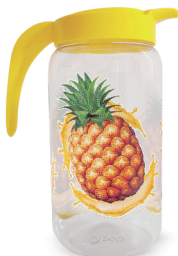
Jarra Abacaxi 1500ml - Caixa 12 unid. Ref.: 991