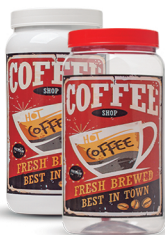
Pote Coffee 1500ml - Caixa 24 unid. Ref.: 354 (Branco) Ref.: 364 (Transp.)