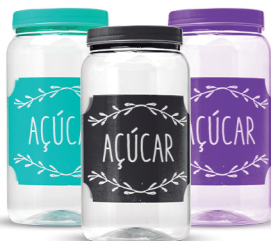
Pote Açúcar 1500ml - Caixa 24 unid.