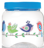
Pote Pássaro 700ml Caixa 24 unid. Ref.: 173