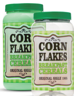
Pote Corn 1500ml - Caixa 24 unid. Ref.: 359 (Verde) Ref.: 369 (Transp.)