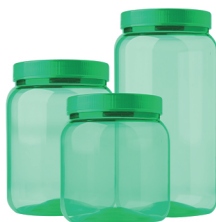
Pote Liso Verde Transparente 700ml / 1000ml / 1500ml - Caixa 24 unid. Ref.: 182 / 282 / 382