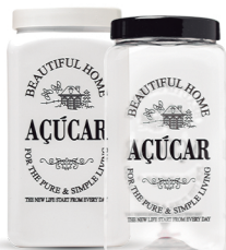
Pote Quadrado Açúcar 1600ml - Caixa 24 unid. Ref.: 981 (Branco) Ref.: 972 (Transp.)