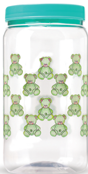
Pote Ursinho 1500ml - Caixa 24 unid. Ref.: 362