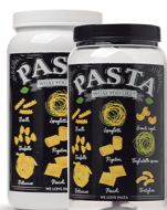
Pote Pasta 1500ml - Caixa 24 unid. Ref.: 360 (Branco) Ref.: 370 (Transp.)