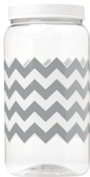
Pote Chevron Cinza 1500ml Caixa 24 unid. Ref.: 391