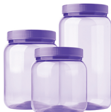
Pote Liso Lilás Transparente 700ml / 1000ml / 1500ml - Caixa 24 unid. Ref.: 183 / 283 / 383