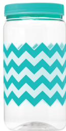
Pote Chevron Tiffany 1500ml Caixa 24 unid. Ref.: 393