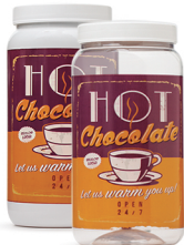
Pote Hot Chocolate 1500ml - Caixa 24 unid. Ref.: 358 (Branco) Ref.: 368 (Transp.)