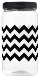
Pote Chevron Preto 1500ml Caixa 24 unid. Ref.: 392