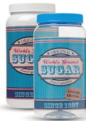
Pote Sugar 1500ml - Caixa 24 unid. Ref.: 357 (Branco) Ref.: 367 (Transp.)