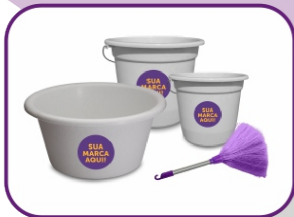
PRODUTOS INSTITUCIONAIS COM MARCA PRÓPRIA

Conheça nossa linha e comprove você mesmo.