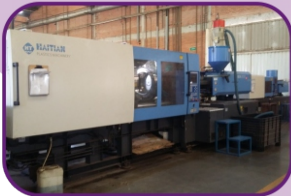
SERVIÇOS DE INJEÇÃO PLÁSTICA