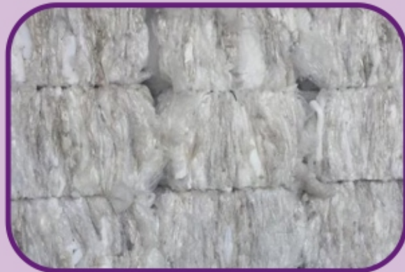
SERVIÇOS DE RECICLAGEM APARAS