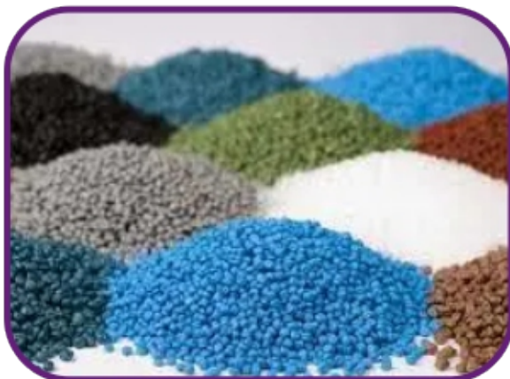
SERVIÇOS DE RECUPERAÇÃO E VENDA DE GRANULADOS